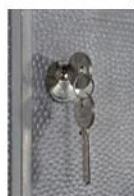
Détail des clés et serrure

Fixation : livrée avec 3 chevilles M10, 3 vis M10 type tire fond et 3 rondelles pour fixation murale.