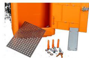
Grille de fond