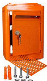
Kit de fixation mural